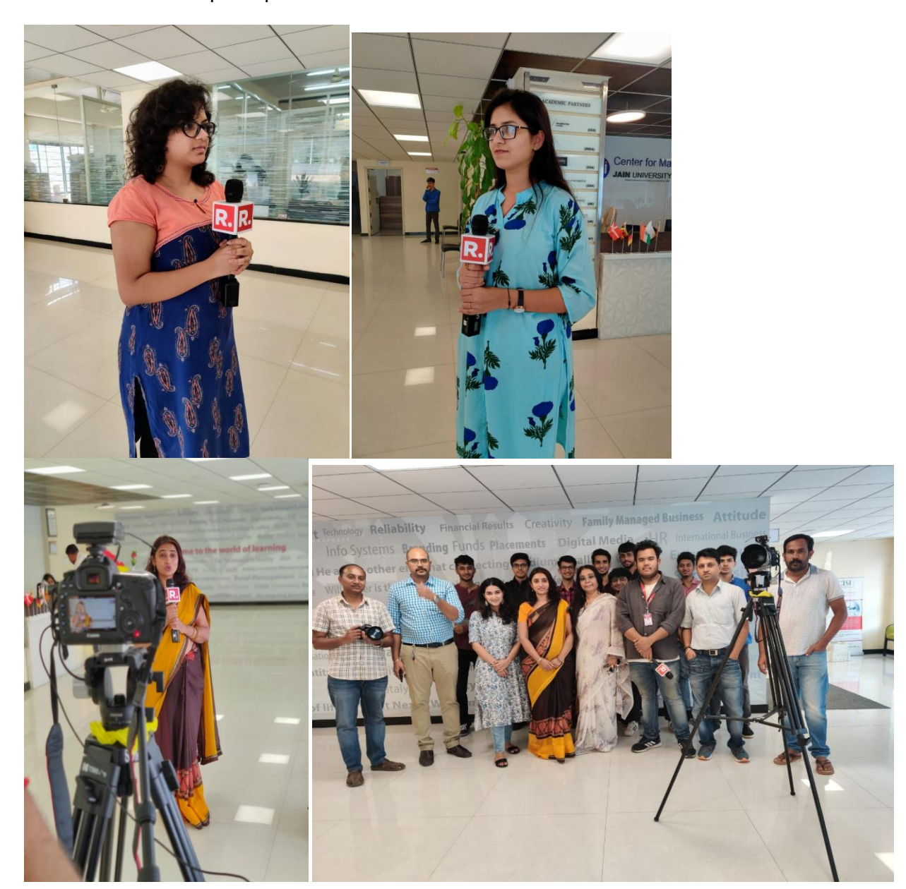
Research presentation by our BAJ final year students

7) Water awareness initiative with collaboration with Republic TV where our BAJ and MAJ students took active participation.